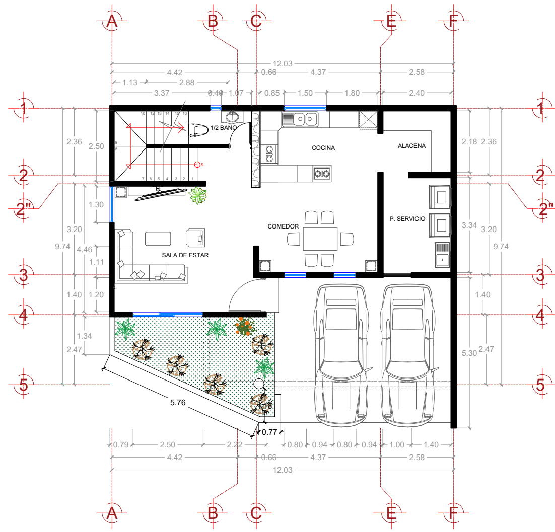
A PLANTA ARQ, PLANTA BAJA