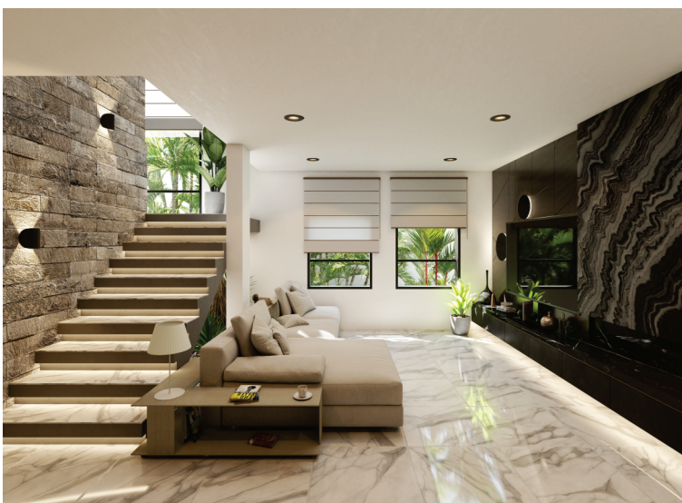
SALA DE ESTAR PLANTA BAJA