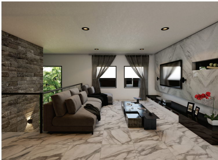
SALA DE ESTAR PLANTA ALTA