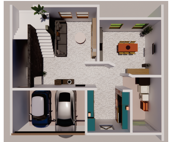
VISTA 3D PLANTA BAJA