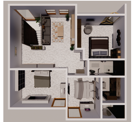
VISTA 3D PLANTA ALTA